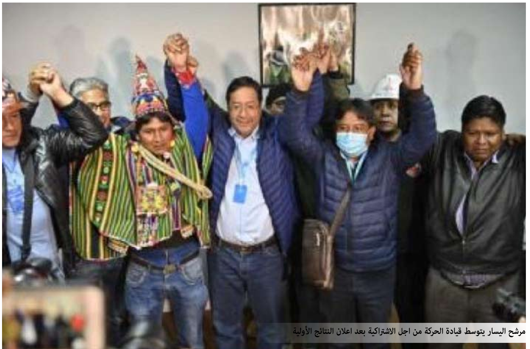
مرشح اليسار يتوسط قيادة الحركة من أجل الاشتراكية بعد اعلان النتائج الأولية

وفي خطاب له في العاصمة لاباز قال الرئيس المنتخب لويس آرسى: "استعدنا الديمقراطية والأمل بيوم سلمي وهادئ، أعطى فيه جزء كبير من البوليفيين اصواتهم". ووعد آرسى بان الرد على نتيجة الانتخابات سيكون الالتزام بالعمل، وبقيادة عملية التغيير دون كراهية والتعلم من الأخطاء. وانه سيحكم باسم جميع البوليفيين، وسيشكل حكومة وحدة وطنية، وسوف يوحد البلاد.