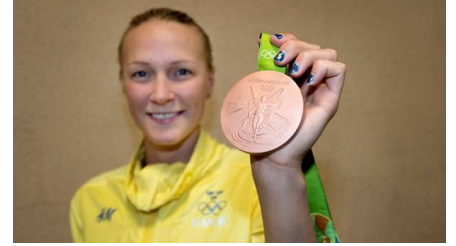
سارة خوستروم

فازت السباحة سارة خوستروم بالمرتبة الثالثة في سباق المئة متر سباحة حرة. لتأتي كل من الأمريكية سيمونه مانويل بالمرتبة الأولى والكندية بيني اوليكسيك في المرتبة الثانية.