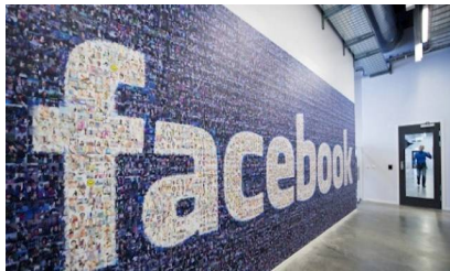
نبض الأوريسند: السويد

هددت وزيرة الثقافة والديمقراطية بأن السويد قد تفرض التزامات قانونية على الفيسبوك كخيار أخير إذا لم تتمكن هذه الشبكة الاجتماعية من اتخاذ إجراءات صارمة ضد خطاب الكراهية والأخبار الوهمية.