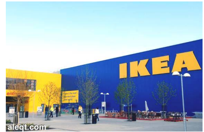
ستوكهولم : (د ب أ)

ذكرت شركة الأثاث السويدية (إيكيا) أن إجمالي الربح السنوي ارتفع بواقع 19.6 بالمئة لتصل إلى 4.2 مليار يورو (4.5 مليار دولار)، منوهة بتحقيق نمو في كل من الأسواق المتقدمة والناشئة.