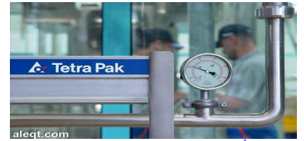
بكين : ( أ ف ب )

فرضت الصين غرامة قدرها 668 مليون يوان (98,5 مليون دولار) على "تيترا باك" بعد تحقيق في قضية احتكار استهدف الشركة السويدية العملاقة لتعليب السوائل الغذائية.