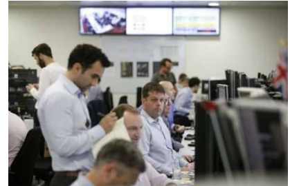
بورصة لندن في 24 حزيران/يونيو 2016

ويقترح ان يدخل القانون الجديد حيز التنفيذ العام 2017 الا ان الشركات التي لا تحترم هذه الحصص لن تعاقب الا اعتباراً من العام 2019 على ما اوضح الوزير مايكل دامبرغ الذي تمنى الوصول الى المساواة بعد فترة. وتبعاً لحجم الشركة، ستتراوح الغرامة بين 250 الفاً وخمسة ملايين كورونة (29 الفاً و580 الف دولار).