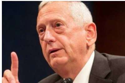
لندن - قریش

حسم الرئيس الأمريكي المنتخب دونالد ترامب الجنرال أمره في رسم سياسته الدفاعية والحربية وإيضاح برنامجه الرئاسي التنفيذي، باختيار أعتى صقور الحروب وزيرا للدفاع في إدارته الجديدة.. انها الجنرال المتقاعد جيمس ماتيس.