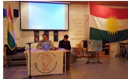
جانب من الفعالية رووداو - كالمار

نظم اتحاد الشباب الديمقراطي الكردستاني-إيران، في مدينة كالمار السويدية، أمس السبت، فعاليةً احتفلوا من خلالها بتسمية "البيشمركة" التي أطلقت على المقاتلين الكورد لأول مرة في يوم 26 ديسمبر من عام 1945، كما