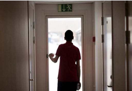
لاجئ مراهق داخل "كامب" اللجوء في السويد

تعمل الحكومة السويدية على تنفيذ قرار تقييم أعمار طالبي اللجوء، الذين وصلوا دون ذويهم إلى البلاد، خلال الربع الأول من العام الحالي.