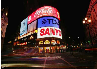
اللوحه الإعلانية الأشهر في لندن تنطفئ بينه ومنوعات - صفحات منوعة

أطفئت أنوار اللوحه الإعلانية الضخمة في ميدان بيكاديلي الشهير وسط لندن، وذلك للمرة الأولى منذ الحرب العالمية الثانية، تمهيدا لاستبدالها بلوحه أكثر تطورا.