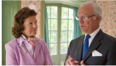
Image caption الملكة سيلفيا والملك كارل في أحد مشاهد الفيلم الوثائقي

وفي كتاب صدر عام 2015 بعنوان "العام الملكي"، قالت الملكة لأحد محاورها إنها كانت وحيدة في عامها الأول كملكة، وواجهت صعوبات في الحياة في قصر يسيطر عليه الرجال.